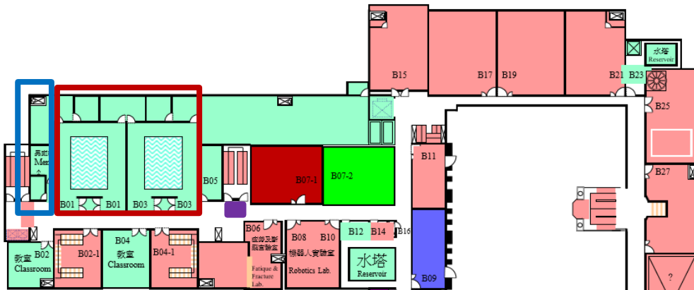
國立台灣大學 工學院綜合大樓 二樓平面配置圖